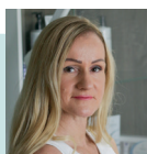
TARDI GINA Elite Skincare